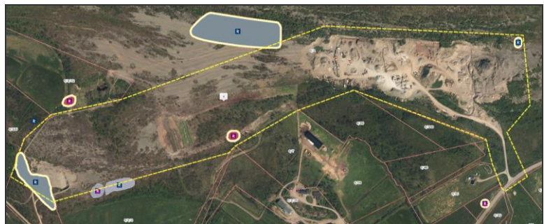
Figur 1 Kulturminner vises her sammen med foreløpig planavgrensning.

Det er registrert automatisk fredede kulturminner innenfor og rundt planområdet. Se figur nedenfor. Disse kulturminnene er kjent og driften av massetaket vil ikke berøre disse. Det vurderes derfor at plantiltaket ikke vil ha vesentlig virkning for Forholdet til kulturminner vil bli nærmere vurdert ifb. planprosessen.