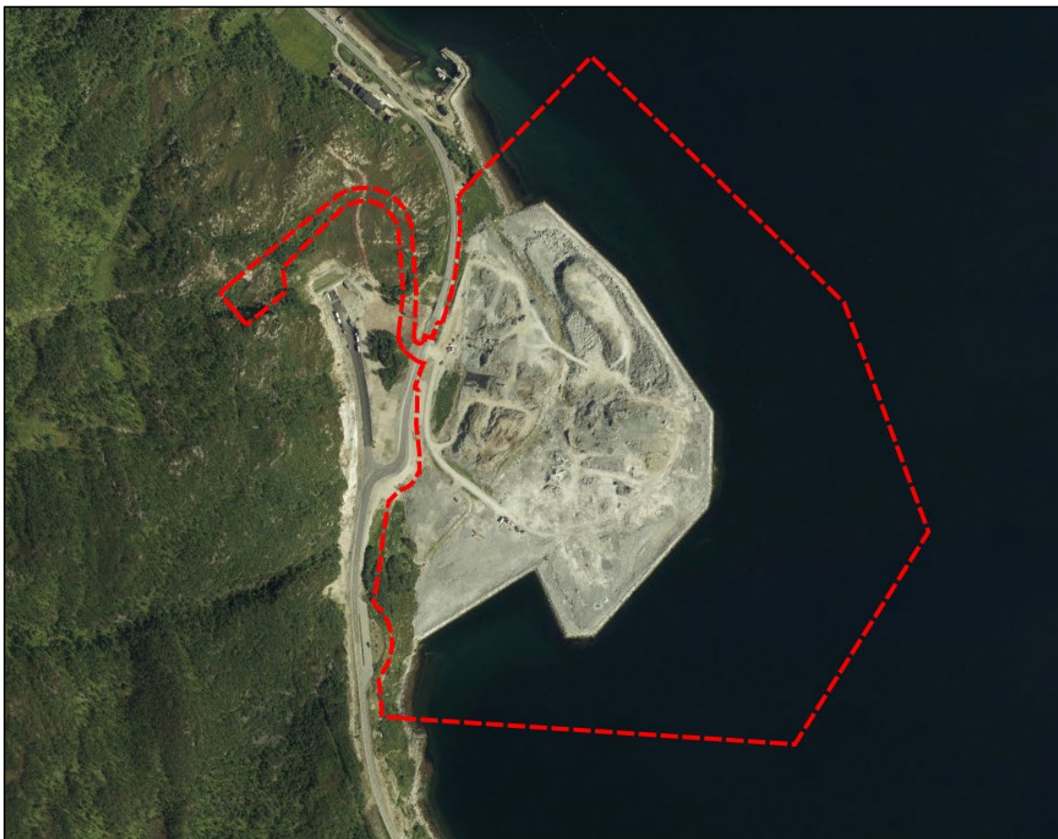
Figur 2 Varslet planområde vist med rød stippet linje, over ortofoto fra 2018.

Det varslede planområdet er omtrent 110 daa og ligger på Langnes, ca. 3 km sør for Isnestoften og 37 km nord for Alta sentrum. Planområdet ligger nedenfor krysset mellom E6 og den kommunale vegen Langnesveien. Arealet er opparbeidet/under opparbeiding i henhold til gjeldende områderegulering. Det er planert og fylt ut i sjø, og klargjøres for etablering av sjøbasert næring/industri.