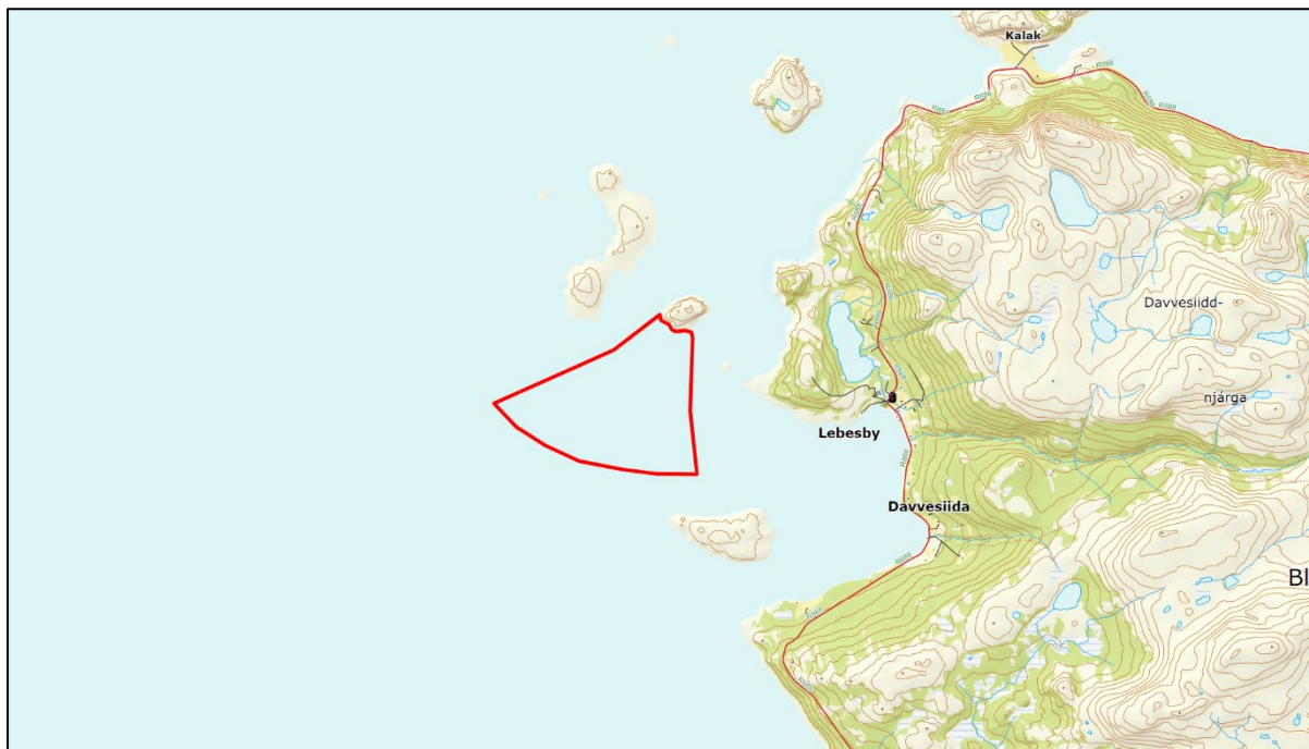
Figur 2: Planområdet markert med rød linje.

Planområdet omfatter delområdene VA_4 «Lille Brattholmen» og VA_F3 «Brattholmen Sør», og omfatter kun areal i sjø. Området er på ca. 3254 daa. Planområdets avgrensning er vist i kartutsnittet under.