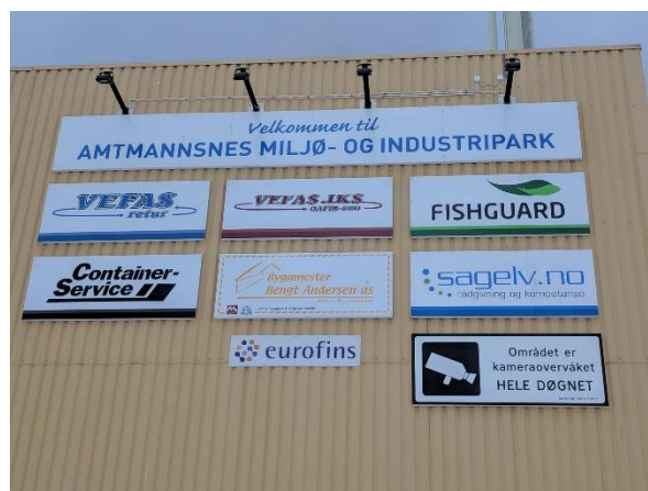
Figur 3 Bedrifter i Amtmannsnes miljø- og industripark

VEFAS Retur AS vurderer, i likhet med Statens vegvesen, at bilbehandlingsanlegget ikke vil bidra med mer trafikk gjennom Amtmannsnes enn det som kan forventes ift. at området er regulert til industri.